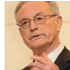
Prof. Dr. Klaus Hänsch, MdEP, Präsident des Europäischen Parlaments a.D.

Die Welt erwartet immer noch viel von Europa. Aber sie wartet nicht auf Europa. Sorgen wir alle dafür, dass die Welt von Europa noch etwas erwarten kann.“